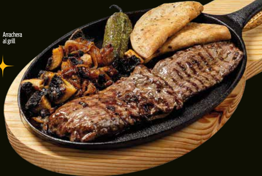
Arrachera al grill