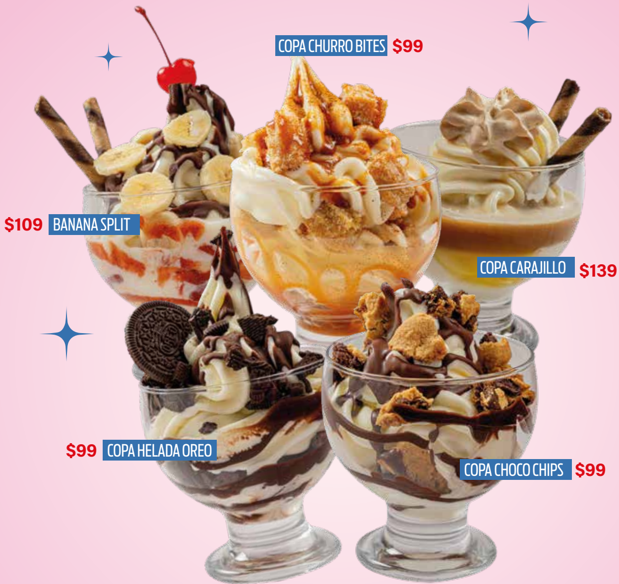
COPA CHURRO BITES $99