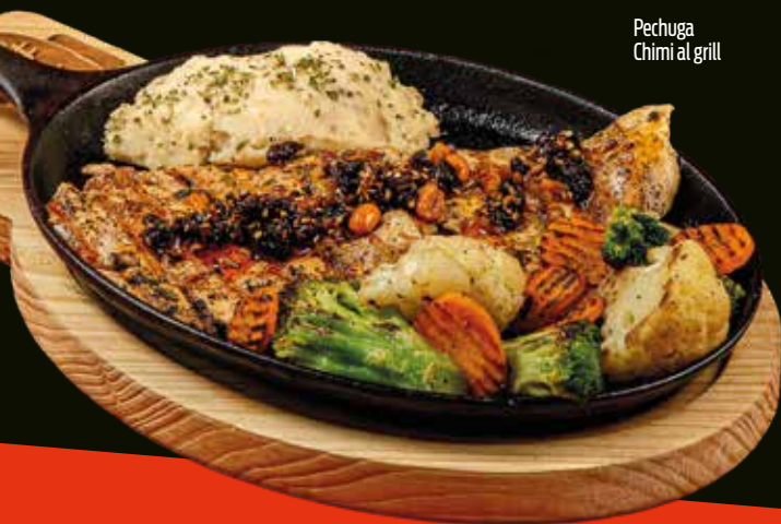
Pechuga Chimi al grill

Pechuga a la parrilla marinada en chimichurri, acompañada con mix de verduras a la mantequilla, salsa macha y pure de papa.