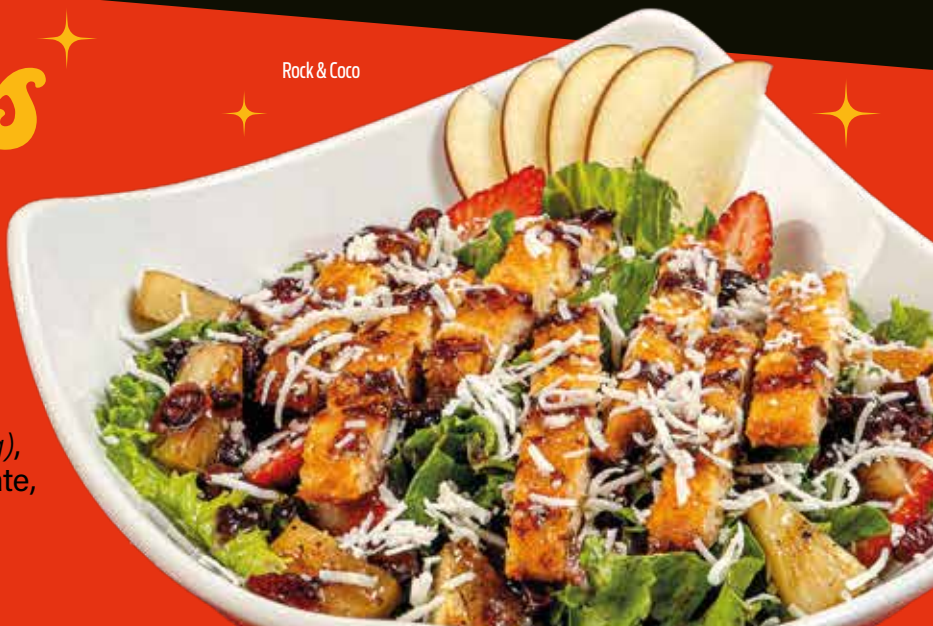
Rock & Coco

Lechuga, boneless Buffalo crujientes (130g), tocino, pimienta, zanahoria, cebolla, jitomate, y aderezo Ranch.